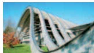
SWISSPANEL® Museo Paul Klee, Berna (CH)