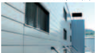
MONTALINE® Lehner Versand AG, Schenkon (CH)