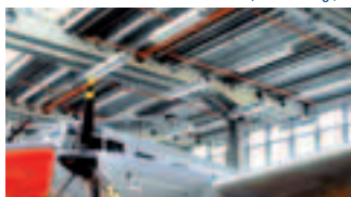
SUPERHOLORIB® Museo tecnico, Berlino (D)