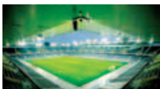
MONTAWALL® Stade de Suisse, Berna (CH)