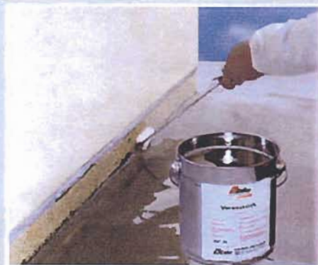
1. Applicare un isolante per una migliore aderenza