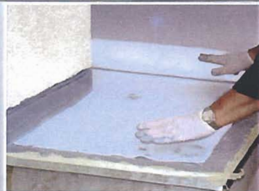
3. Inserire senza grinzhe il velo in polyflex nello strato di fondo