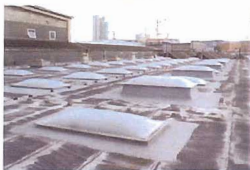
Calotte a lucernario