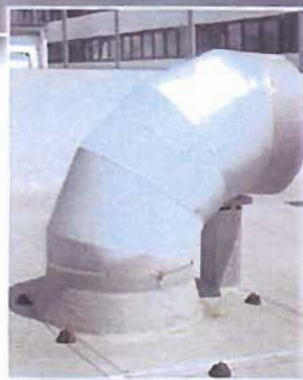
Pozzi di ventilazione