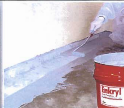
4. Stendere lo strato di copertura a raso