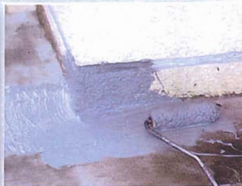
2. Stendere lo strato di fondo a raso