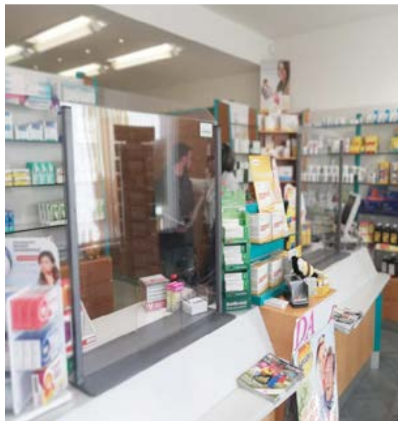
Modello 80x90 con apertura, Farmacia di Innsbruck