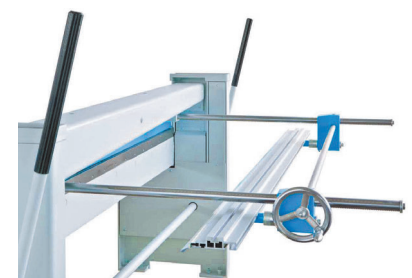
manueller Tiefenanschlag 0-750 mm (Serienausstattung)